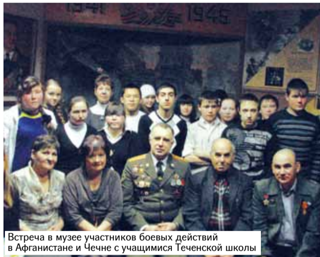
Встреча в музее участников боевых действий в Афганистане и Чечне с учащимися Теченской школы

Исполнилось 25 лет Сосновскому районному историко-краеведческому музею