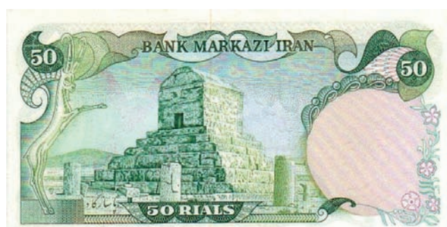
■ Мавзолей Кира Великого на банкноте 50 риалов. 1974 год

Есть версия, что настоящая могила Кира II Великого находится под «Кубом За-