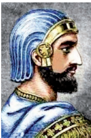
■ Кир II Великий

жена из пяти больших камней. По своему внешнему виду данный мавзолей целиком совпадает с описанием того памятника, который исследователи искали длительные десятилетия. Так что сомневаться в его подлинности экспертам не приходится.