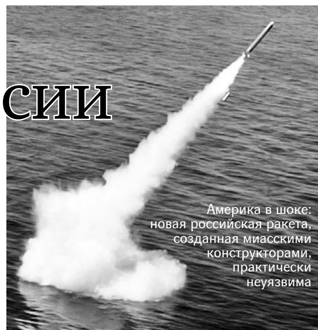
Америка в шоке: новая российская ракета, созданная миасскими конструкторами, практически неуязвима

«Лайнер» представляет собой модернизированную версию ракеты «Синева». Сохраняя все преимущества своей предшественницы, он отличается от базовой ракеты не