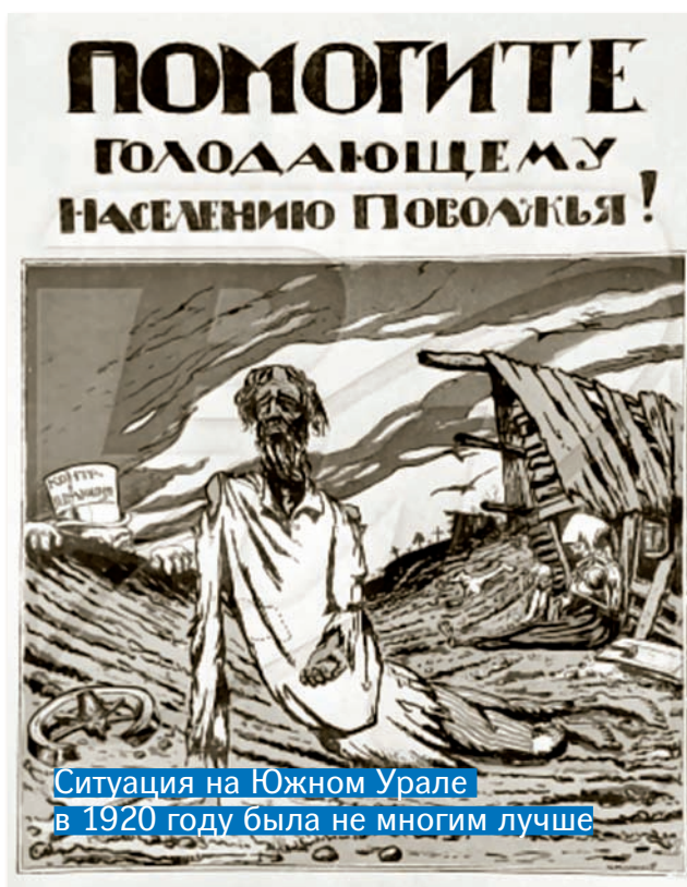
Ситуация на Южном Урале в 1920 году была не многим лучше

Ради справедливости скажем: у коллективизации 1930-х годов – этого «грандиозного» большевистского эксперимента над селом – есть одно, пусть и условное оправдание. Массовый отток крестьян в города стал главным условием стреми-