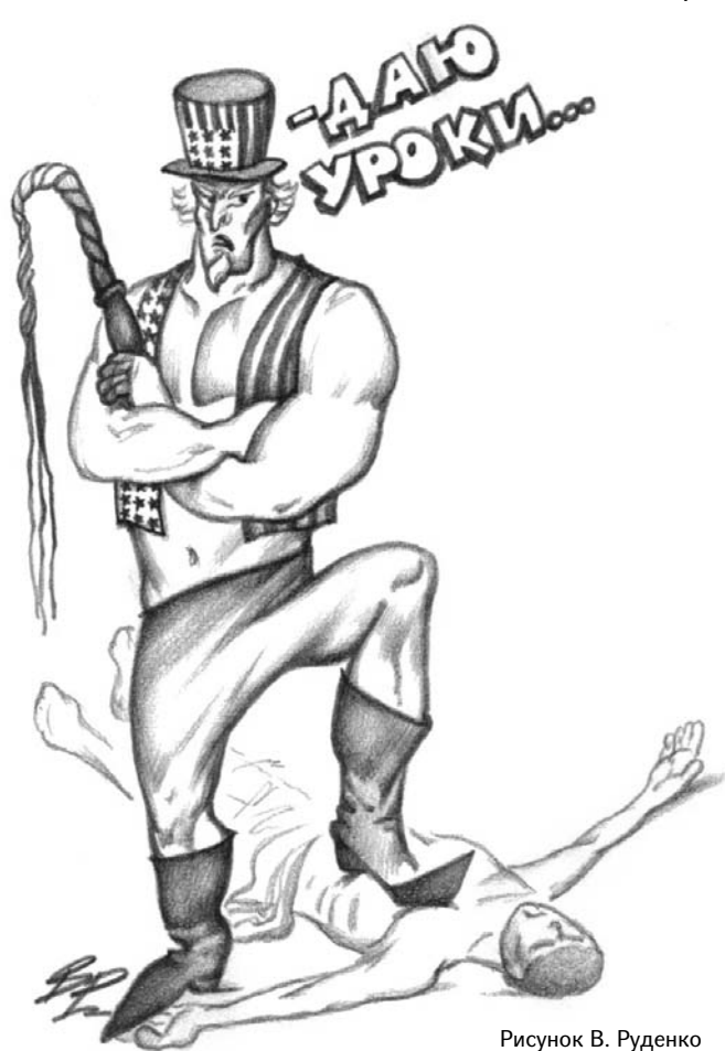
Рисунок В. Руденко

Между тем, сообщения о том, как полковника Каддафи замучили до смерти, а изуродованный труп выставили на обозрение в торговом центре, вызывают оторопь даже у нас, давно не вздрагивающих от словосочетания «гуманитарная бомбардировка». Ведь нам так долго объясняли, что бомба, попавшая в роддом, –