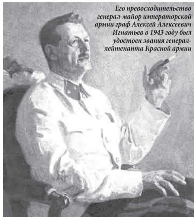
Его превосходительство генерал-майор императорской армии граф Алексей Алексеевич Игнатьев в 1943 году был удостоен звания генерал-лейтенанта Красной армии

Сидеть на шее русского народа им было очень удобно, и слезать не хотелось. Правда, и белым помощь от дворян была мизерной. Судите сами. К маю переломного 1919 года численность ударных группировок белых составляла: армия Колчака – 400 тыс. человек; армия Деникина (вооруженные силы Юга России) – 150 тыс. человек; армия Юденича (Северо-Западная армия) – 18,5 тыс. человек. Итого: 568,5 тыс. человек. Это, главным образом, «лапотники» из деревень, которых под угрозой расстрела загоняли в строй и которые потом целыми армиями(!), как у Кол-