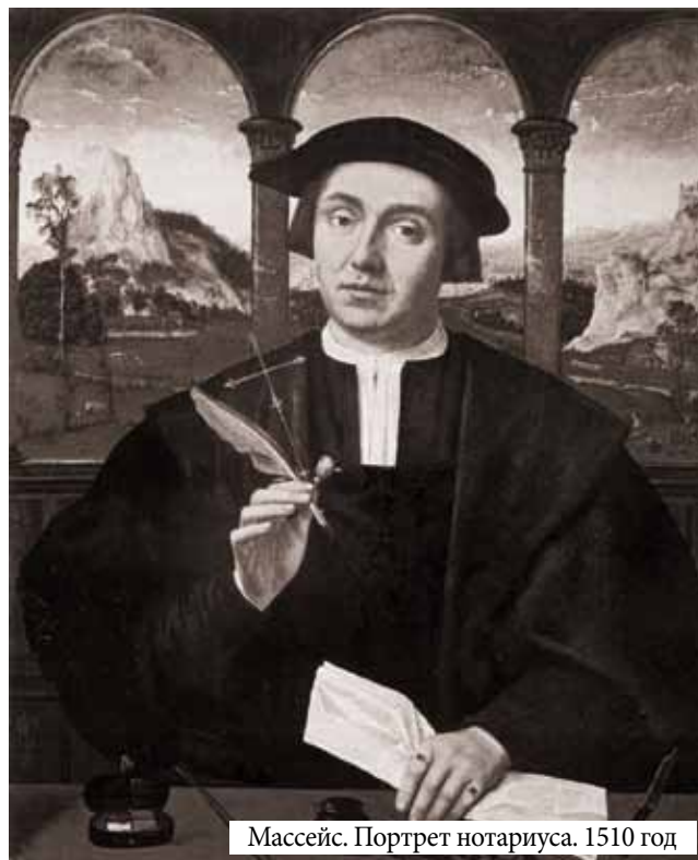
Массейс. Портрет нотариуса. 1510 год

определенном месте; – удостоверяют тождественность гражданина с лицом, изображенным на фотографии; – удостоверяют время предъявления документов; – передают заявления физических лиц и юридических лиц другим физическим и юридическим лицам; – принимают в депозит денежные суммы и ценные бумаги; – совершают исполнительные надписи; – совершают протесты векселей; – предъявляют чеки к платежу и удостоверяют неплатеж чеков; – принимают на хранение документы; – совершают морские протесты; – обеспечивают доказательства; – выдают свидетельства о праве на наследство; – принимают меры к охране наследственного имущества; – совершают иные нотариальные действия, предусмотренные законодательными актами РФ.